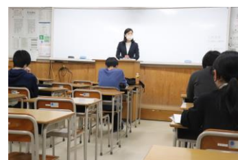
就職支援アドバイザーによる講義

フレックス株式会社、第一貨物株式会社、高崎建設株式会社、有限会社裕真 デイサービス・マロニエ、スリーアイ松浦有限会社、大和紙器株式会社、 株式会社フジダン、社会福祉法人美里会、陸上自衛隊、海上自衛隊 ほか