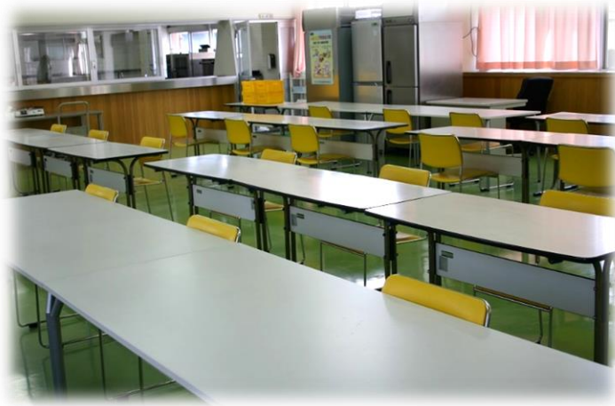
【別紙2】 給食室内の配置図